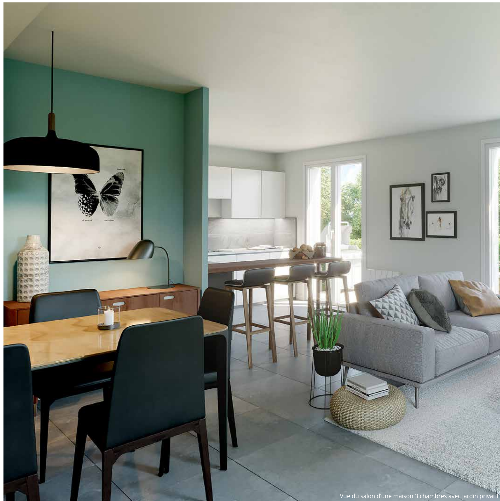
Vue du salon d'une maison 3 chambres avec jardin privatif

À l'étage, l'espace nuit est distribué par un grand dégagement. Les chambres sont intimes et cocoon. Les prestations et les aménagements sont de grande qualité. Chaque maison du « Clos des Tulipes » bénéficie, par ailleurs, d'un garage latéral ou situé en fond de parcelle, à l'arrière des jardins. La propriété comporte aussi des places de stationnement aériennes pour les résidents et leurs visiteurs. C'est un véritable art de vivre pérenne que vous réserve le « Clos des Tulipes ».